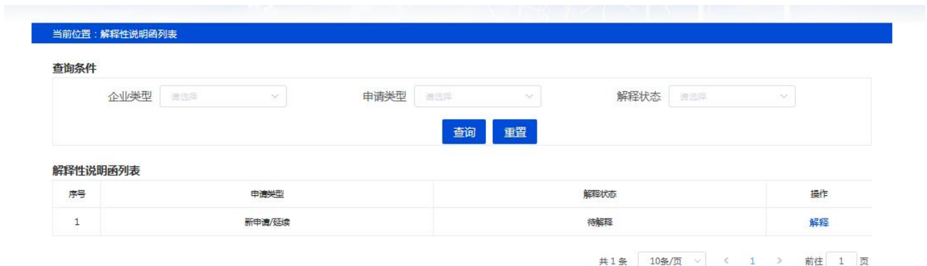
图 10-3 解释性说明函页面

企业用户登录系统，点击系统首页“待办任务”-“解释性说明函”，进入解释性说明函页面如下：